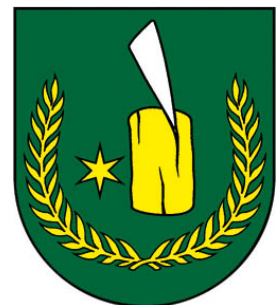
Obrázok 2 Erb obce

Erb obce Klin nad Bodrogom tvorí v zelenom štíte strieborný sklonený klin, zaseknutý do zlatého pňa, sprevádzaného vpravo zlatou hviezdou - to všetko ovenčené zlatými vetvičkami. Erb obce je zapísaný v Heraldickom registri SR pod signatúrou K-263/2006.